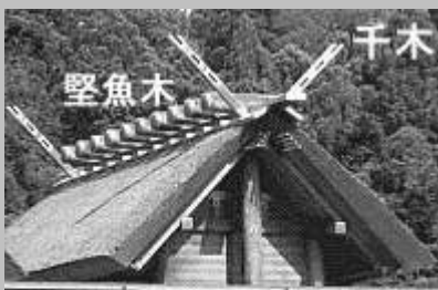
神明造 切妻に丸太柱が特徴 (伊勢神宮)

本殿の屋根に見られる神のシンボル。仏教伝来以前の古い様式の神社建築には標準的に備わる。仏教伝来以後の仏教色を帯びた建築では省略されることが多い。