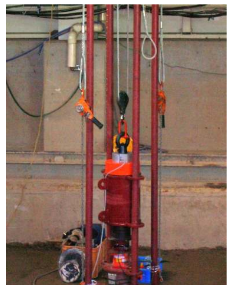
写真-1,2 急速載荷試験装置の例 (システム計測製)