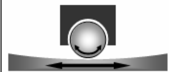
転がり系免震装置の例

現在、住宅向けに通用しているものの多くは、免震機構にローラーやベアリングを採用した転がり系やすべり系。積層ゴム等の弾性系は少ない。制御面はトリガーなどのロック機構により、一定以上の揺れに対してのみ動作するような設計となっている。なお、住宅ではフレキシブルジョイントの配管設備や50cm程度の水平変位を想定した余裕のある建物配置も必要。