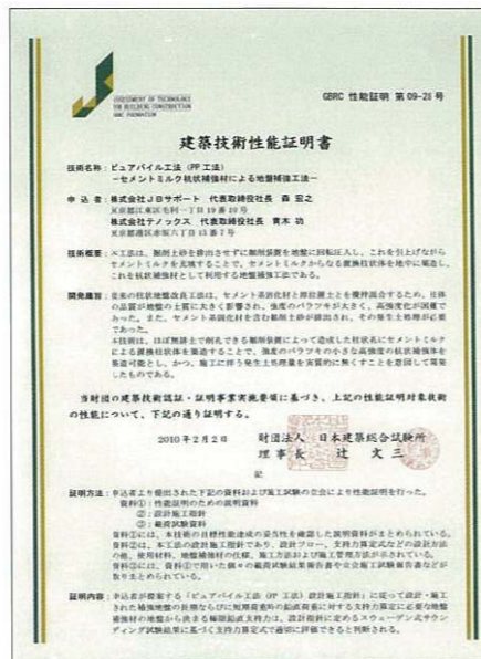
建築技術性能証明書